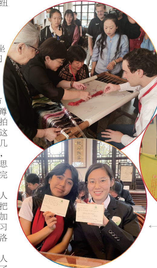
向他们介绍苏高中的校园、文庙和碑刻博物馆沿途的历史遗迹，而美国的

一大早，这批兴致勃勃的美国客人就来到了江苏省苏州中学校，开启了一天紧锣密鼓的苏州行程。苏中的学生们和来访的美国学生结对，用英语