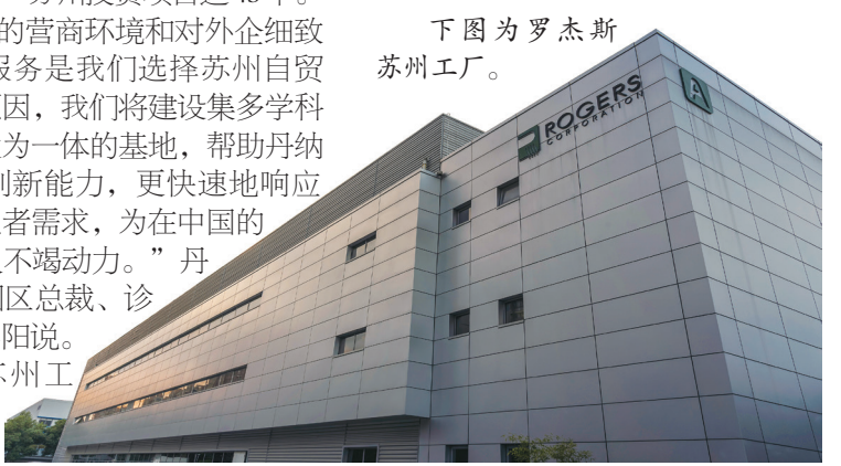
下图为罗杰斯苏州工厂。

园区成立，是首个在中国投资建厂的外资体外诊断IVD企业。这个基地是集智能制造与丹纳赫商业系统为一体的超级工厂。基地引入了多条全球领先的产线，成为苏州首家实现化学发光免疫设备、自动化流水线本土生产的该行业外资企业。去年下半年，丹纳赫医学诊断平台中国研发制造基地在苏州正式投入使用，这是丹纳赫迄今在华最大单体直接投资项目。