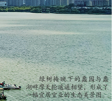
绿树掩映下的蠡园与蠡湖畔摩天轮遥遥相望，形成了一幅宜居宜业的生态美景图。