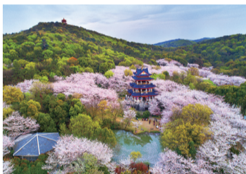
4月初，鼋头渚樱花谷樱花盛开，美不胜收。

一组数据显示，自2021年连续3年，滨湖高新技术产业产值占规模以上工业总产值比重逐年上升，始终稳居无锡市第一。如果你到滨湖来，会发现这里充满奇思妙想，欢迎更多人来湖湾创业创新。