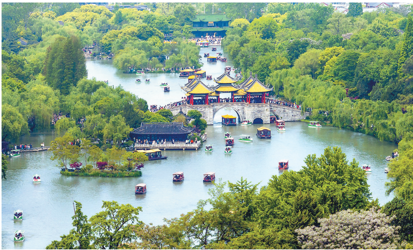
5月2日，扬州瘦西湖美景引得众多游客前来参观游玩。