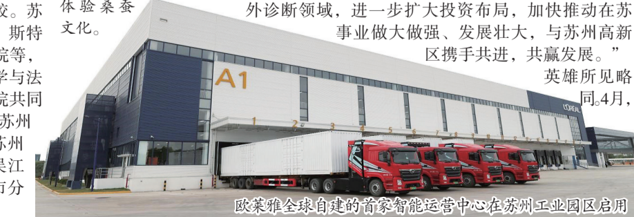
欧莱雅全球自建的首家智能运营中心在苏州工业园区启用