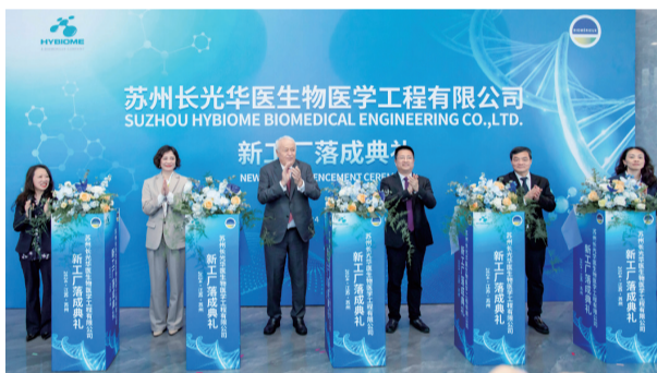
法国生物梅里埃公司控股公司的新工厂落地苏州高新区。