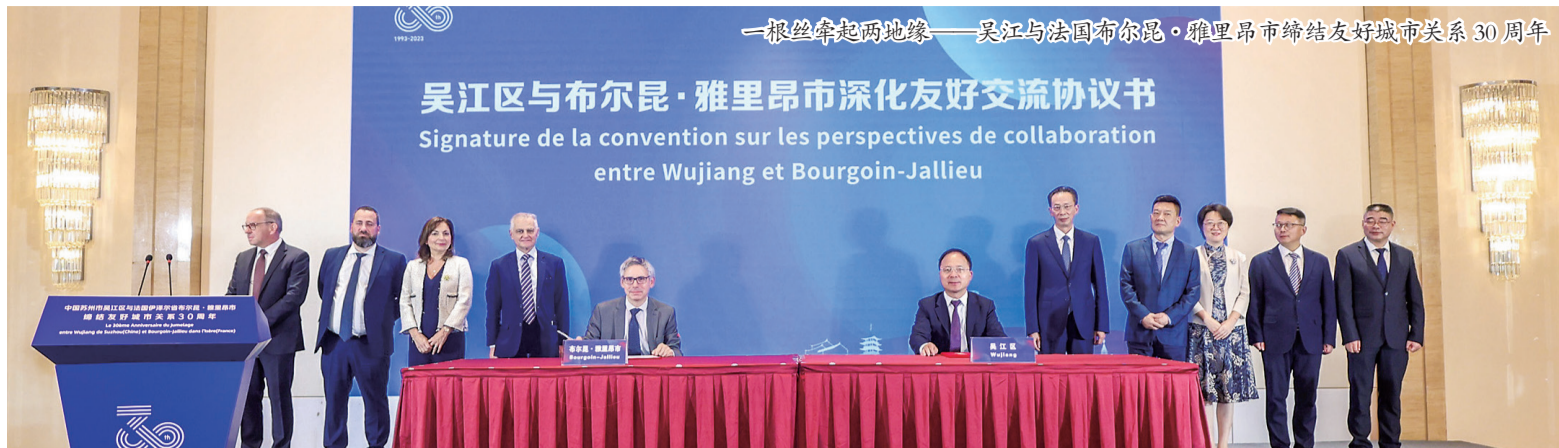
一根丝牵起两地缘——吴江与法国布尔昆·雅里昂市缔结友好城市关系30周年

今年，中法建交迎来60周年。如果宇宙真的有“量子纠缠”，那一定存在于中国苏州和法国诸多城市之间。搜索一下“中国苏州”和“法国巴黎”，互联网呈现的第一个搜索结果是这样的文字：苏州和巴黎两个城市都是世界级的旅游胜地；两个城市都拥有先进的基础设施，为居民提供了良好的生活环境；两个城市都有着悠久的历史，拥有