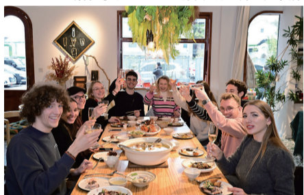
2024年2月，法国留学生在苏州过中国春节。

在美丽的“浪漫之都”法国巴黎，西南郊圣雷米·奥诺雷市隐藏着法国首座苏州园林怡黎园。由上世纪80年代中国留学生与苏州园林局合作设计建造。回廊、花墙、山石和飞檐，莫不展示出苏州园林的诗情