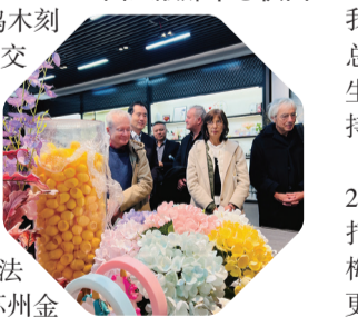
2023年11月，法国友人在苏州体验桑蚕文化。