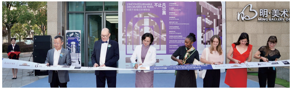
← 2023年第二届金鸡湖中法文化艺术周期间“不止凡尔赛”主题展开幕。园区融媒体中心供图