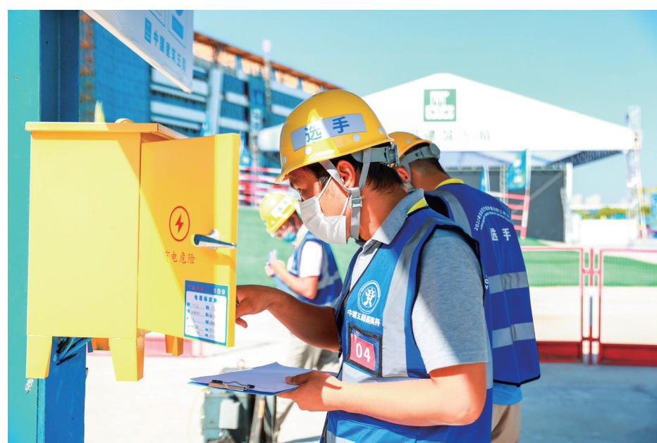
参赛选手同台竞技，一展风采。