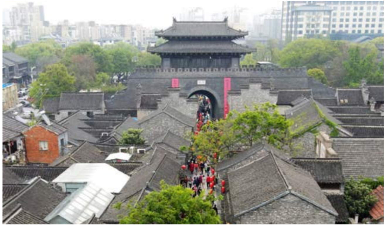
入選揚州“運河十二景”的明清古城，是中國東南沿海地區規模最大、風貌保存最為完好的歷史城區之一。

乘坐水上觀光巴士到運河三灣看蒲葦花開，到揚州中國大運河博物館看運河前世今生……大運河是揚州重要的文化資源。8月，揚州“運河十二景”對外發佈，這是揚州運河“最古老、最核心、最精華、最有活力一段”的集中展現。