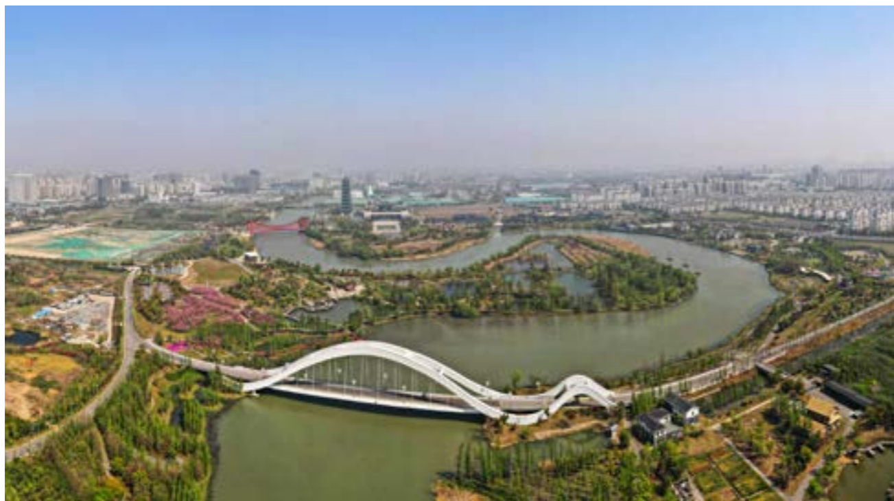
揚州古運河。

“伴美麗運河同行，與中華文化齊舞。希望通過這次雲端之旅，加深海外華裔青少年等新僑群體對中華文明悠久歷史和寶貴價值的瞭解和熱愛，記住歷史、記住鄉愁，增強對祖籍國的認同和自豪感。”龐春奎如是說。