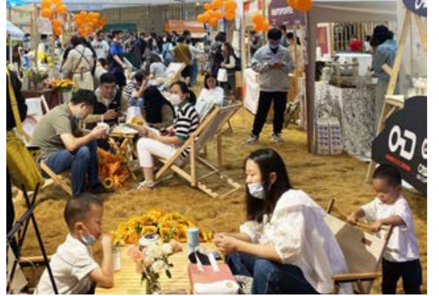
民眾體味著咖啡迷人的香醇。

愛咖啡“遇見”系列活動由揚州市商務局作為指導單位，由揚州報業傳媒集團、揚州運河文化投資集團、揚州萬象匯聯合主辦，其中本次咖啡文化周“遇見”系列活動分為三場，分別是：遇見藝術家、遇見“思想家”、遇見運河十二景。揚州市商務局相關負責人告訴中新網記者，希望通過本次系列活動，打響揚州咖啡文化消費新名片、新時尚，促進城市的消費加快恢復和高品質發展。