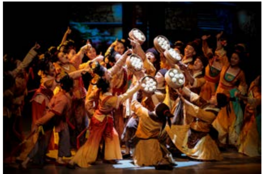
一聲“包子來嘍”，做工精美，口味鮮美的包子，就開啟一整天的熱氣騰騰。

甚至是大賽水準相媲美的，我們在保證了專業性的同時，還保留了面向大眾審美的煙火氣，能讓觀眾們感覺到好聽、好看、好感動。”