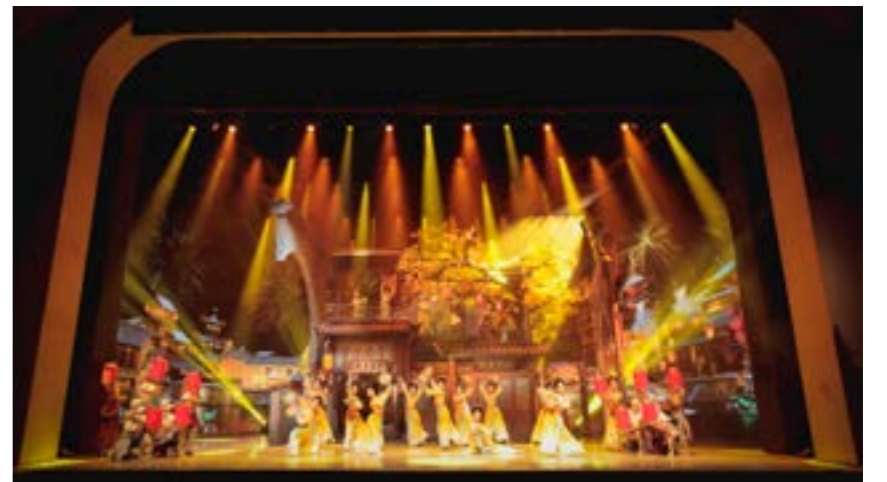
8月28日晚，沉浸式大型音樂舞蹈詩《大運揚州——琴鶴同鳴》在揚州運河大劇院首演。