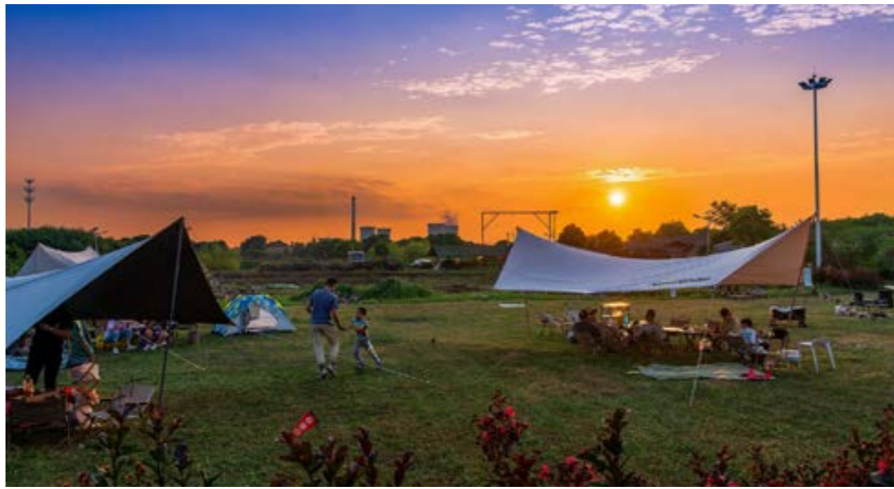
搭帳篷、住民宿、賞月色……中秋假期，揚州遊客在鄉野草地野營。