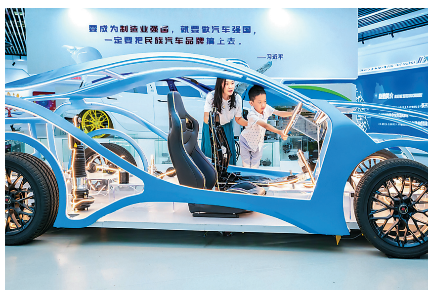
8月17日，泗洪机械零部件制造产业园展示厅免费向公众开放。

位于南通市经济开发区的江苏御江环保有限公司危废“绿岛”试点项目，是投资4000万元新建的5000吨/年危险废物收集贮存转运、2.5万吨/年度矿物油及含废矿物油废物收集贮存转运项目，建成后将成为开发区及周边区域众多中小微企业的危险废物收集、贮存、转移中心。