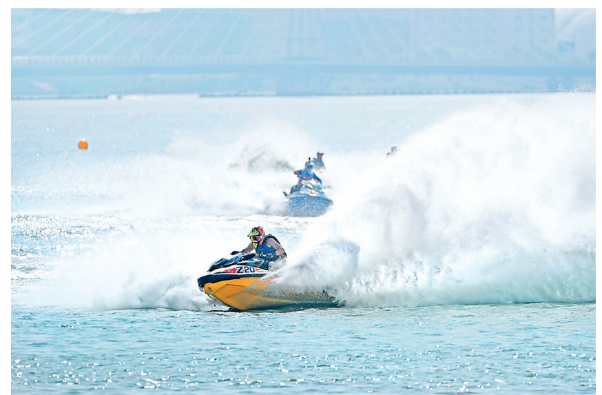
8月19日，2022全国摩托艇锦标赛在常州武进区西太湖火热开赛。本次赛事是中国最高等级的水上运动摩托艇的赛事，来自全国16个省市以及部分高校的26支队伍齐聚常州西太湖进行激烈角逐。（夏展希摄）

阿曼达里斯·林恩是南京师范大学附属扬子中学的一名外教，她最喜欢的是蜀山古南街，看着古街一侧蠡河穿流而过，街上遍布紫砂壶店、茶馆，还有紫砂壶大师顾景舟的故居，她说，“喜欢喝茶的我来到宜兴紫砂的发祥之地参观，真是件很幸运的事情。”（付岩若）