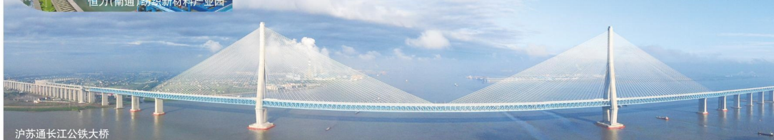
沪苏通长江公铁大桥

城市能级的竞争，归根到底是经济实力的竞争。2020年，南通GDP总量突破1万亿，达10036.6亿元，位列中国第17位，江苏省第4位。2021年，南通市完成地区生产总值11026.9亿元，增长8.9%；一般公共预算收入710.2亿元，增长11.1%；全社会研发投入占地区生产总值比重2.62%；固定资产投资增长5%，社会消费品零售总额增长16.8%，进出口总额增长29.7%；城乡居民人均可支配收入分别达到57289元、29134元，增长9.2%、11.4%。