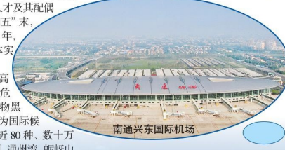
南通兴东国际机场

本版编辑: 南通市人民政府侨务办公室 南通市人民政府新闻办 南通报业传媒集团 电话: 0086-513-85099225 0086-513-85098580 传真: 0086-513-51015719 0086-513-85098580 E-mail: 1011500517@qq.com 545262287@qq.com 联系地址: 江苏省南通市崇川区工农南路88号 邮编: 226000