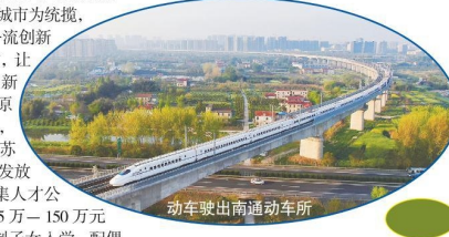
动车驶出南通动车所