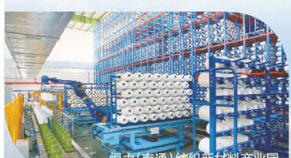
恒力(南通)纺织新材料产业园