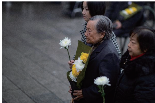
▲11月25日，南京大屠杀遇难者家庭祭告活动在侵华日军南京大屠杀遇难同胞纪念馆遇难者名单墙前举行。图为南京大屠杀幸存者夏淑琴（右二）参加南京大屠杀遇难者家庭祭告活动。 决波 摄