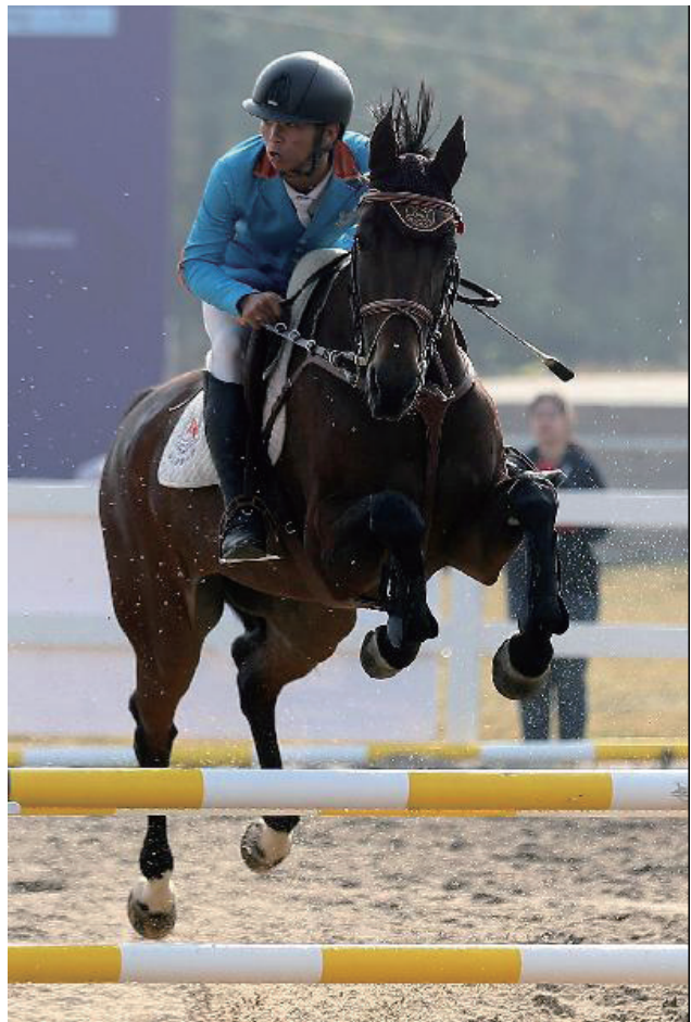
▲近日，在南京首届马术比赛嘉年华活动中，参加障碍赛的马术运动员驰骋赛场，一展英姿。