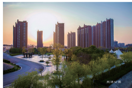
东进公园时代豪庭

江苏东台，素有“黄海明珠”之称，市域总面积3176平方公里、江苏省县域最大，辖14个镇和4个区，总人口113万。东台既是一方底蕴深厚的人文胜地，又是一座富有活力的魅力新城，在全国百强县（市）中排名第40位，荣获全国工业百强县（市）、中国优秀旅游城市、国家卫生城市、国家园林城市、国家生态示范区、国家现代农业示范区和江苏人居环境奖城市等众多美誉。