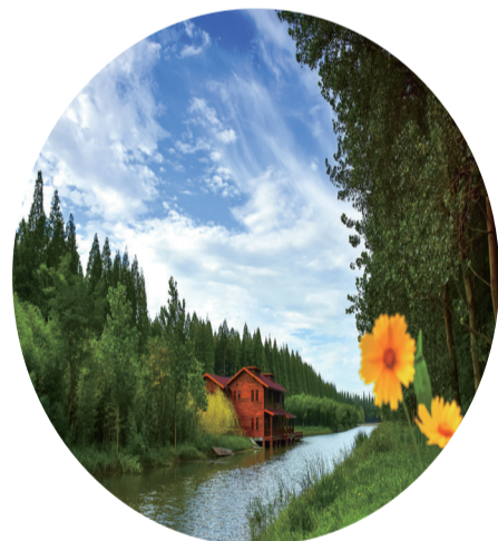
森林公园