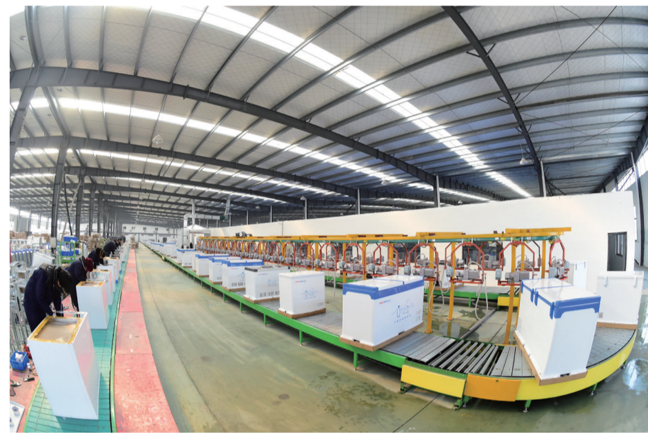
江苏美百加电器科技有限公司

基础设施:建成区内基本实现了“八通一平”,核心区达到了“九通一平”,全区道路共计119条、194.227km,河道12条、65公里,景观绿化、照明、管网等配套工程同步推进,“九纵八横”的交通动脉全面畅通。科技综合体:西交大宿迁科技园、威诺检测等一批科技综合体加快推进,为工业突破提供了坚实的载体支撑。学校:全区共9所中小学,其中,九年一贯制1所,中学1所、小学6所,28所幼儿园。全区教师总数共2266人,中小学在校生25647人。医院:全区共5家民营医院,4家卫计服务中心,32个村(社区)标准化卫生室,医务人员共1117名。