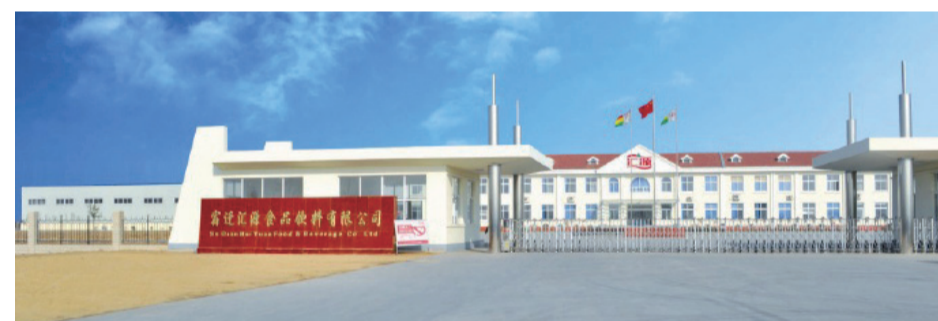
下图:宿迁汇源食品饮料有限公司