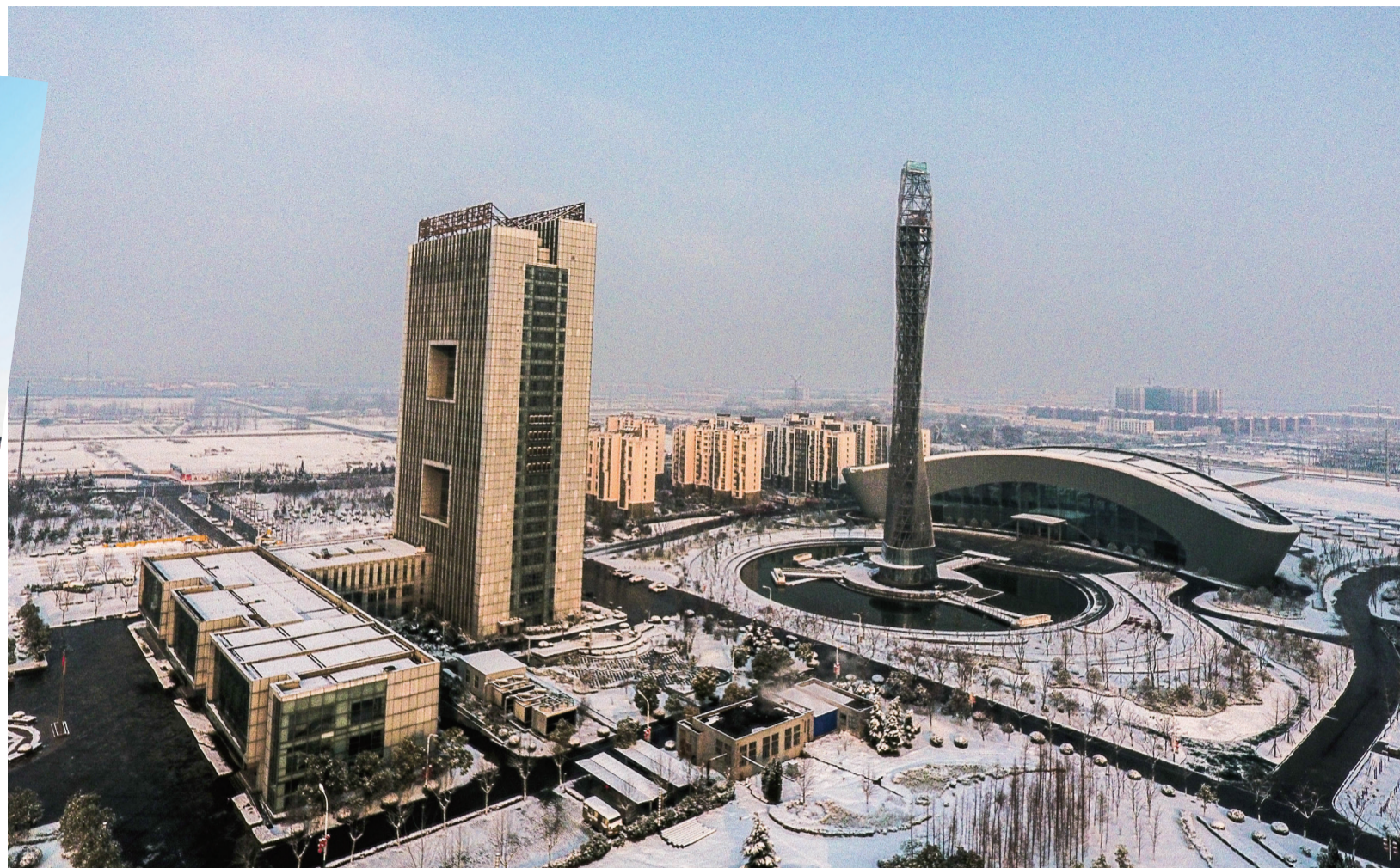
宿迁经济技术开发区管理委员会 (商务中心)

宿迁经济技术开发区(以下简称“经开区”)成立于1998年11月,2013年1月升格为国家级开发区,现辖一乡三街道(南蔡乡,三棵树街道、黄河街道、古楚街道),行政管辖面积118.8平方公里,社会人口20万。2019年,全区实现规上工业总产值229.3亿元,同比增长30%;规上工业增加值48.2亿元,同比增长31.2%;财政总收入27.68亿元、同比增长16.9%,一般公共预算收入10.85亿元,同比增长13.9%。