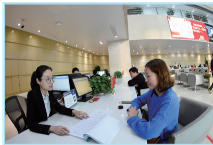
上图:宿迁经济技术开发区行政审批局

格力大松、双鹿上菱、韩电电器等项目为代表的整机生产企业,和以东贝机电、精诚模具为代表的配套产品生产企业,获批“省级先进制造业基地”“中国家电产业基地”和“省级特色创新(产业)示范园区”等称号。食品饮料产业方面,已经集聚了海天、娃哈哈、汇源、康师傅、蒙牛、西麦等一批知名企业,获批“国家级食品产业园”。新型电子信息产业方面,目前集聚了聚灿光电、天合光能、长光通信3家规上企业。2019年,三大特色产业全年实现规上工业总产值125.99亿元、占规上比重54.9%。