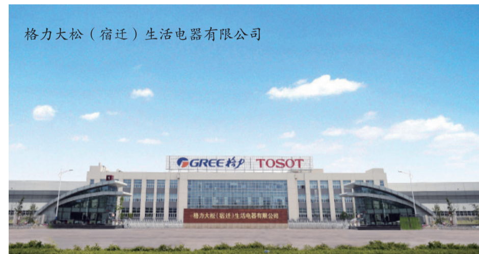
格力大松(宿迁)生活电器有限公司

始终坚持“无事不扰,有求必应”的服务原则,为企业“贴心式、保姆式、专家型”全程服务,打造经开区帮办服务品牌。大力深化项目帮办服务人制