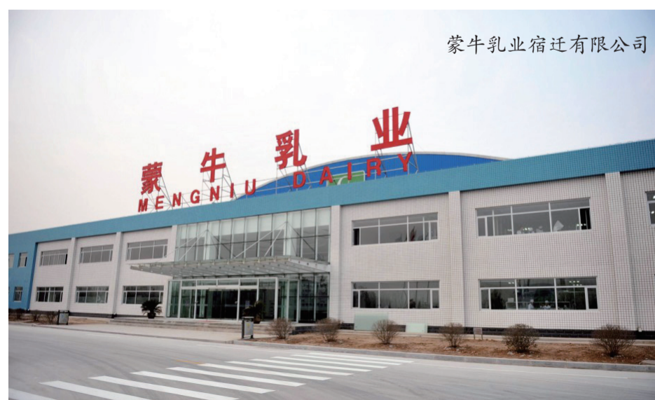
蒙牛乳业宿迁有限公司