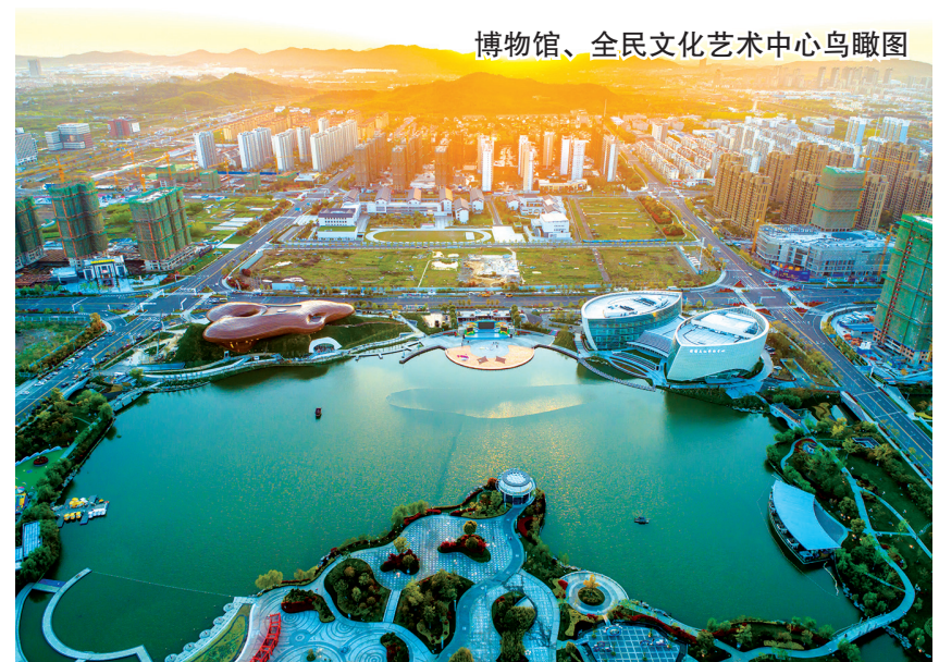
博物馆、全民文化艺术中心鸟瞰图