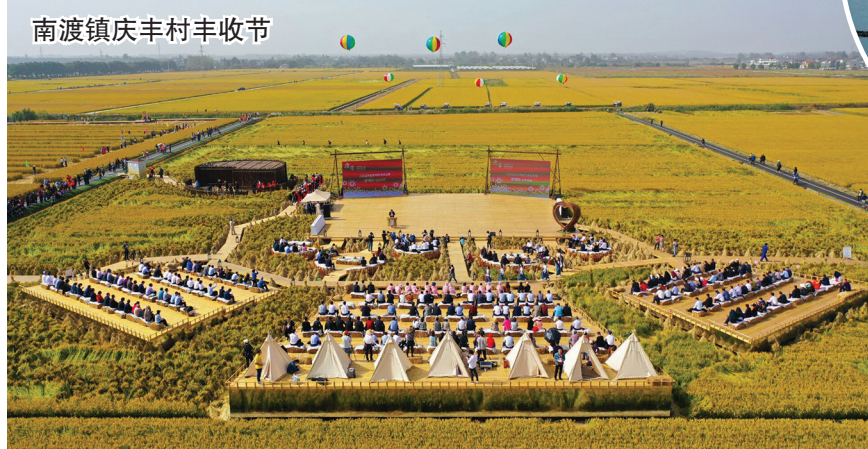
南渡镇庆丰村丰收节

行驶于“溧阳 1 号公路”，一路“彩虹”线相伴，与两边竹林、树林、田野同行，沿途“神女之心”“爱情的套路”“天路”等主题景观点更成为游客心中的“必到”打卡点。紧跟时代潮流，“溧阳 1 号公路”还是一条智慧之路，推出“溧阳行”“溧阳交通”等手机 APP，游客扫一扫二维码，就能轻松获得旅游信息、道路出行信息、景区（点）承载信息，还能根据需求为游客匹配更多经典旅游线路，帮助游客发现途中美景、美食、美景。春暖花开，何不自驾游溧阳，在 1 号公路来一场惊喜之旅、发现之旅。